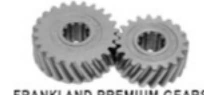
FRANKLAND PREMIUM GEARS