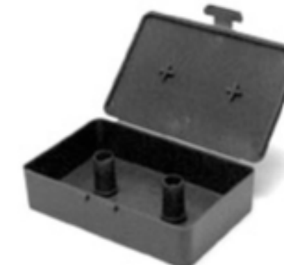
QUICK CHANGE GEAR BOX